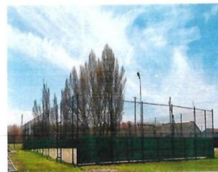
Спортивная площадка по мини - футболу

Село благоустроенное, школа после капитального ремонта. Школа малокомплектная, в ней обучается 43 учащихся. Начальные классы: 2 класса – комплекта (1 и 3 классы, 2 и 4 классы). На территории школы имеется спортивная площадка по мини – футболу.